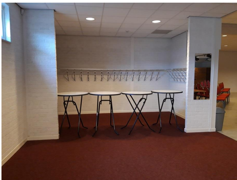
Afbeelding: afgesloten garderobe

De garderobe is afgesloten met statafels, zie foto hieronder. In de communicatie vooraf en bij ontvangst door de koster worden bezoekers verteld dat ze hun jassen mee naar hun stoelen nemen.